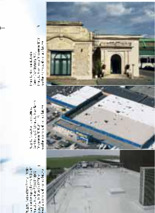
Per il restauro di edifici storici e monumenti, si consiglia l'uso di membrane sintetiche impermeabilizzanti.