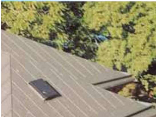
Progetto: Alkor Design - Ristrutturazione e impermeabilizzazione di una copertura metallica. Via: Via S. Vito, 10 - 00144 Roma (RM) Telefono: +39 06 47811111 - Fax: +39 06 47811112