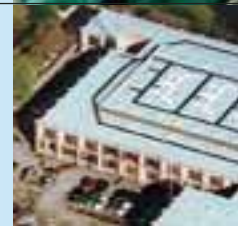
Per coperture industriali e commerciali, si consiglia l'uso di membrane sintetiche impermeabilizzanti.