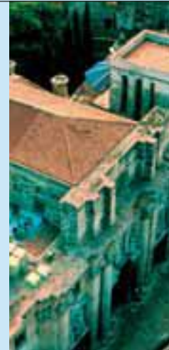
Per il restauro di edifici storici e monumenti, si consiglia l'uso di membrane sintetiche impermeabilizzanti.